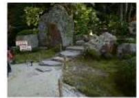
方丈庭園には約10段の 段差があり、車椅子の 方の拝観は難しい