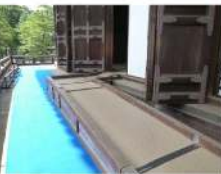
御影堂の拝観までは無料